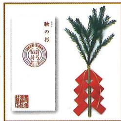
しるし 験の杉(初午御幣束) (一体 700円)

境内では、食べるお守りである「揚護符」[験(しるし)の杉](初午御幣束)授与や御神楽・お囃子・太鼓など様々な芸能行事が奉納されます。