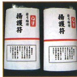
あげごふ 揚護符 (一体 500円)

又、大変貴重な天然黄繭で奉製し捻り多き一年を願う初午限定の「黄金繭守(こがねまゆ)」の頒布も致します。