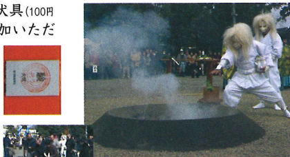
▲神使いの狐による火伏神事 ◀一般参拝者による火伏神事