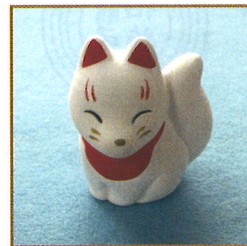
稲荷みくじ (一体 500円)